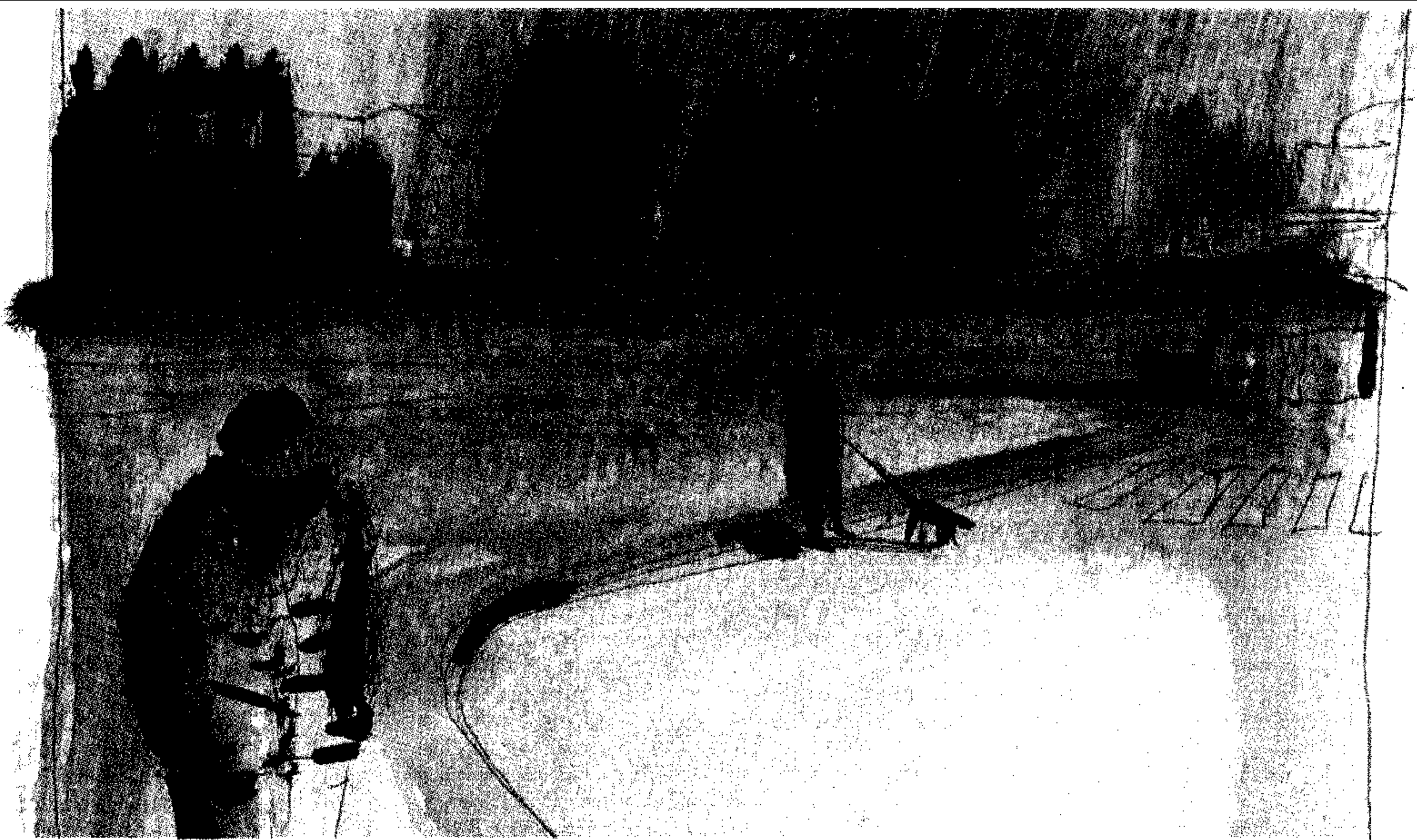
Il disegno di Marco Paci